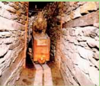
Bergbaumuseum im Ridnauntal Museo della Miniera - Val Ridanna