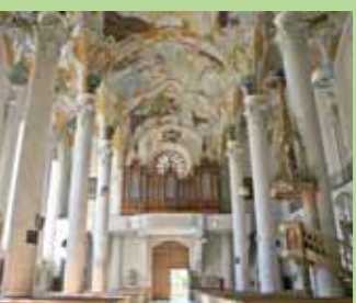
Stadtpfarrkirche Chiesa Parrocchiale