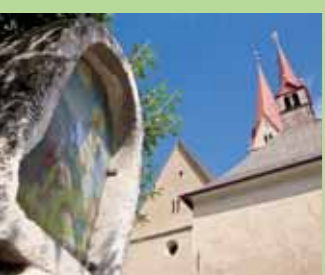
Wallfahrtskirche Maria Trens Santuario Maria Trens