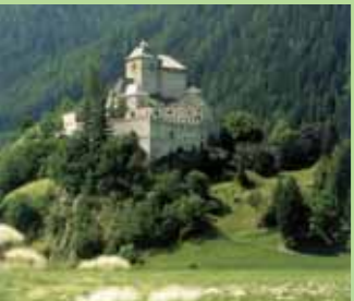
Schloss Reifenstein Castel Tasso