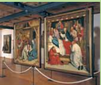
Multscher- und Stadtmuseum Museo Multscher e civico