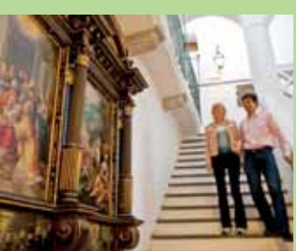
Rathaus Sterzing Municipio di Vipiteno